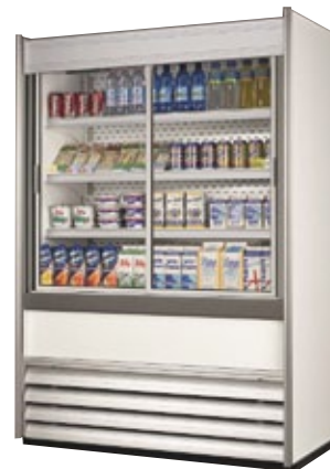
> Version standard à portes coulissantes