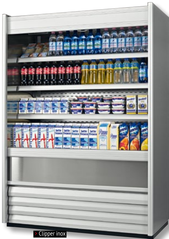
> Clipper inox