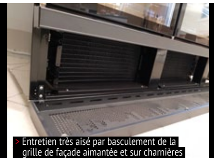
> Entretien très aisé par basculement de la grille de façade aimantée et sur charnières