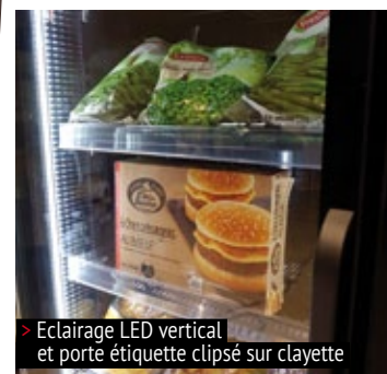
> Eclairage LED vertical et porte étiquette clipsé sur clayette